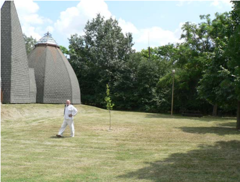
1. kép – út felől