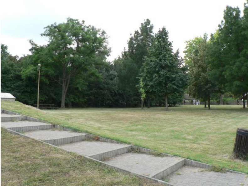
2. kép – kápolna elől