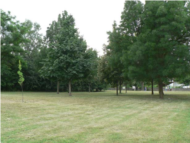
3. kép – kápolna felől